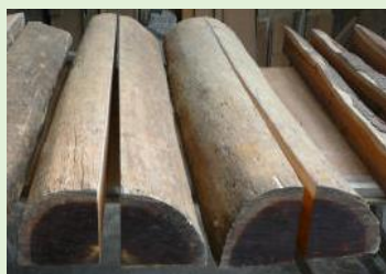
Bois bruts et bois sciés

Concernant le Pernambouc, les spécimens que l'on retrouve dans le commerce :